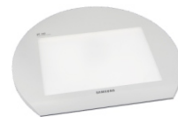
Lichtbox SLB-130 (optional)