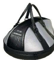
Transporttasche (im Lieferumfang)